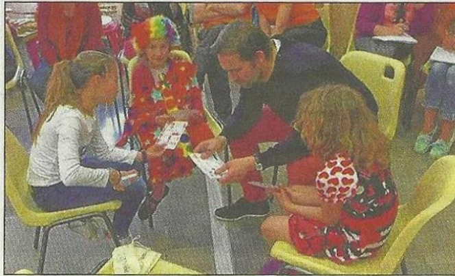
les enfants, eux aussi impliqués.